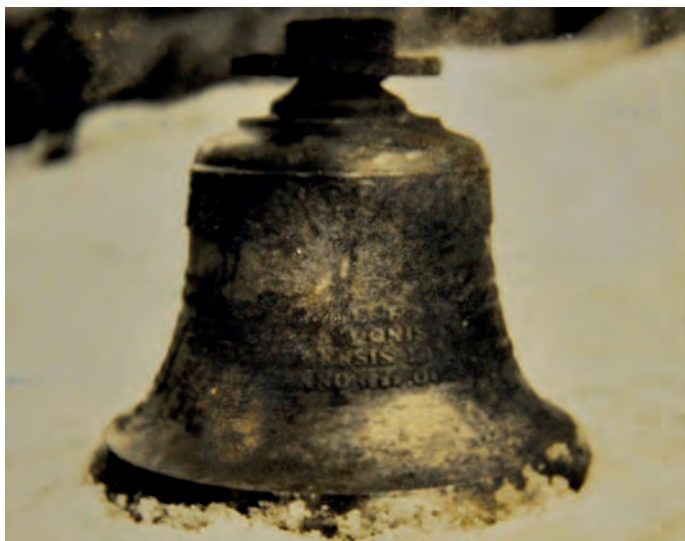
zvon Petr z roku 1922 při sejmutí 18.3. 1942

NOBIS“ (česky „Svatý Petře, oroduj za nás“) replikuje prosbu obou Petrových předchůdců z r. 1741 a 1922 a souzní s identicky pojatou prosbou na zvonu sv. Pavla na malé věži, vedle kterého je sv. Petr zavěšen. Čtyřveršový chronogram na protější straně pláště metaforicky předává informaci o kontinuitě, současně působí dekorativně a zní: PROTOŽE OHEŇ POHLTIL A VÁLKY OLOUPILY, DOBREM VĚRNÝCH CHVAL PÁTÝ K ŽITÍ ZNÍ. Doplňující jednoduchý nápis na věnci zcela civilně informuje o příležitosti odlití – dokončení obnovy zvonů.