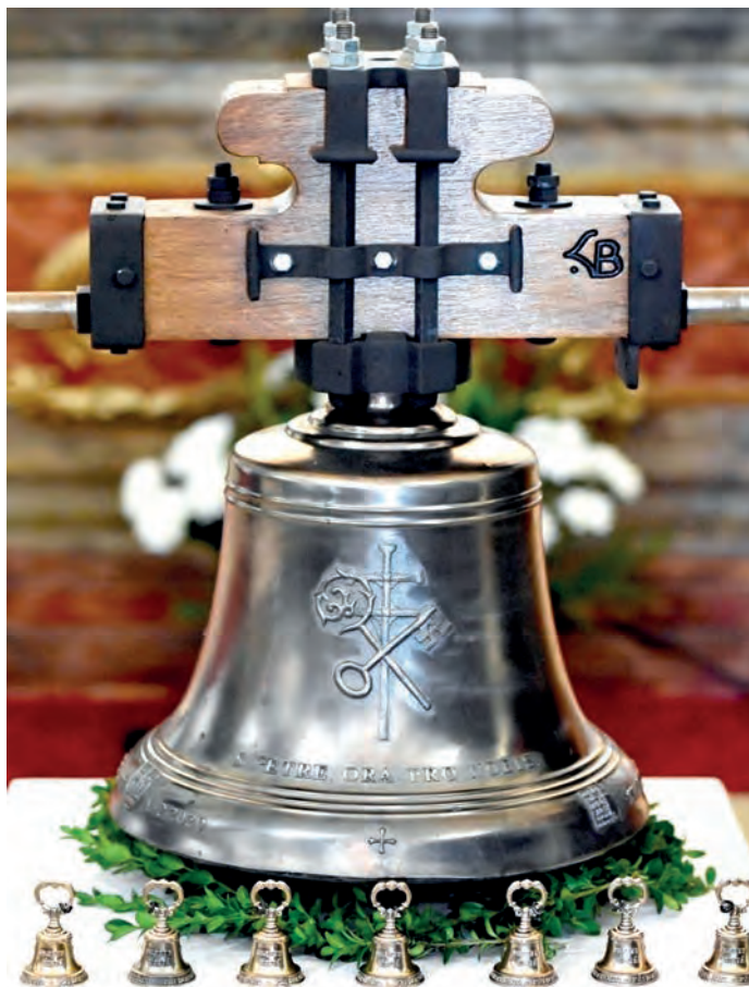
Nový zvon v den požehnaní a zavěšení 17.10.2021