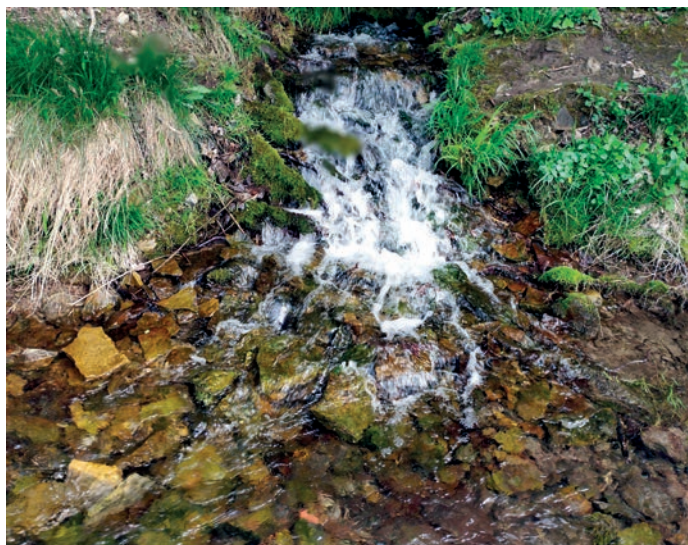
Foto z údolí Jalového potoka