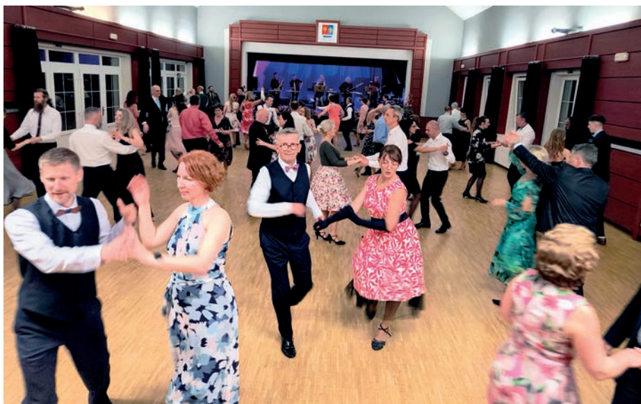
6. Taneční ples v Čisté 6. 4. 2024