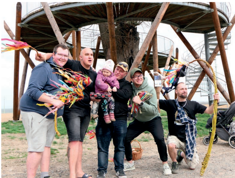
Tradiční setkání na Velikonocce u Fajmonovy lípy a vyhlídky 1. 4. 2024