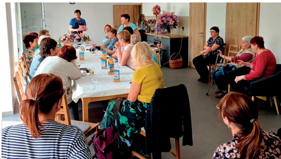
Ukázka aranžování v komunitní místnosti KODUSu 6. 4. 2024