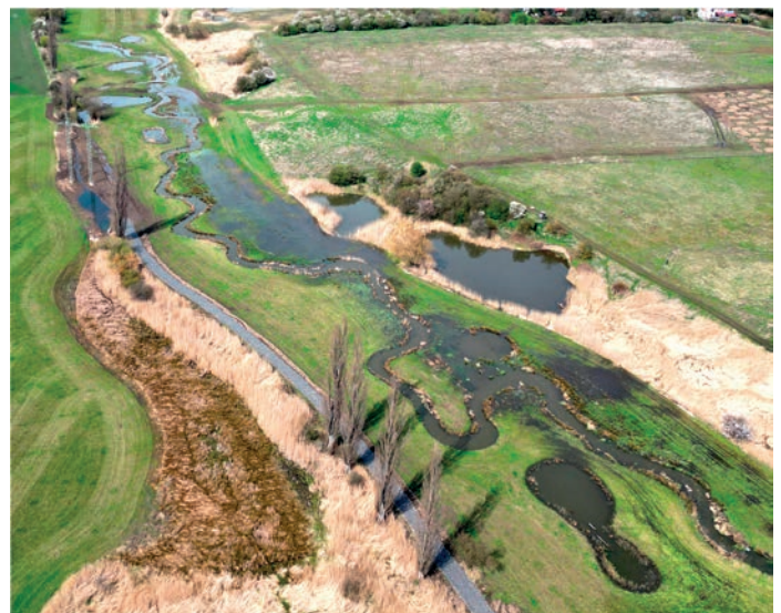
ukázka revitalizace toku