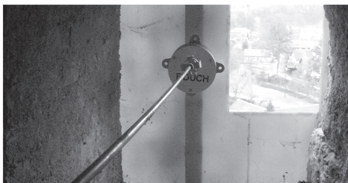
Ciferník „naruby“. Místa uvnitř je opravdu málo, servisní okénko je jen o maličko větší než půlka běžné novinové stránky. Kdo si pozná svůj domeček?