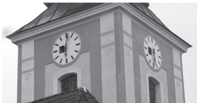
Nevidaný pohled z montáže, kdy ručky před seřízením ukazovaly na každém ciferníku jiný čas. Tmavý obdélník vlevo na ciferníku je otevřené servisní okénko.