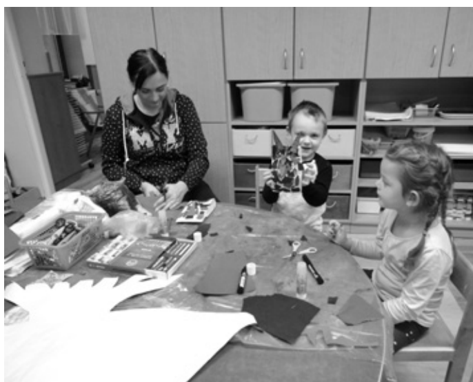
Děti byly za svoje snažení odměněny štědrú vánoční nadílkou.