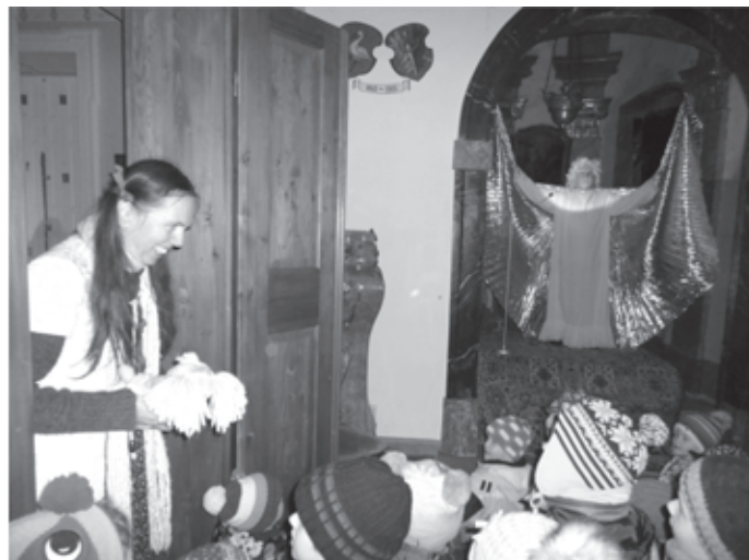
K Vánocům patří také pohádky. Nemohl proto chybět „Knížkový den“. Děti měly možnost přinést do MŠ svoji oblíbenou nebo rozečtenou knihu.