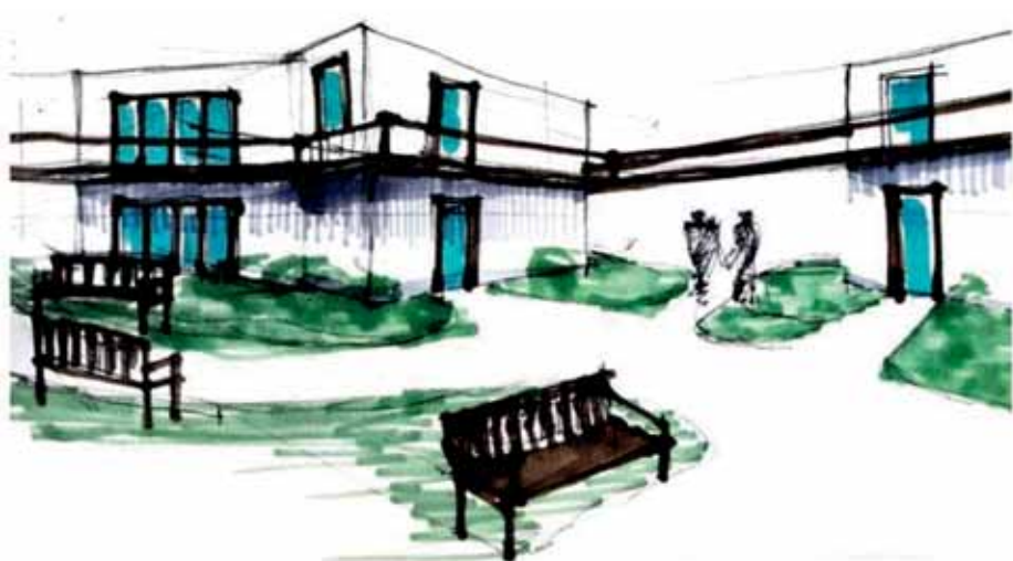
Skica jednoho ze studentů

Snažíme se najít co nejefektivnější uspořádání pozemku i podobu staveb, zároveň však požadujeme příjemné prostředí pro život a setkávání. Jednoduše místo pro život na vsi ve 21. století. Studenti přišli s řadou zajímavých nápadů. Některé návrhy jsou konzervativní,